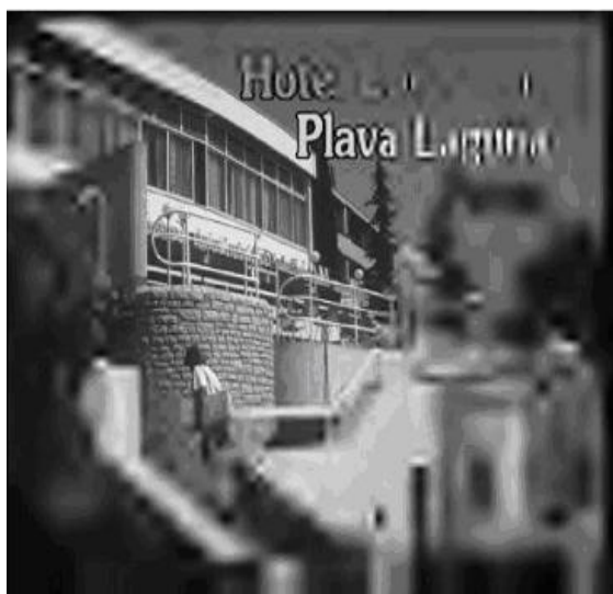
Hình 3: Minh họa tính năng ROI

JPEG 2000 còn một tính năng đặc biệt ưu việt hơn JPEG, là khả năng vượt trội trong khôi phục lỗi. Đó chính là khi một ảnh được truyền trên mạng viễn thông thì thông tin có thể bị nhiễu, với các chuẩn nén ảnh như JPEG thì nhiễu này sẽ được thu vào và hiển thị, tuy nhiên với JPEG 2000, do đặc trưng của phép mã hóa có thể chống lỗi, JPEG 2000 có thể giảm thiểu các lỗi này với mức hầu như không có.